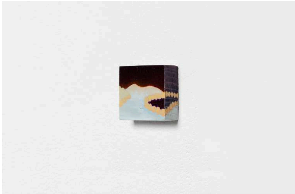
Sophie Varin - Truth Gap 1, 2021