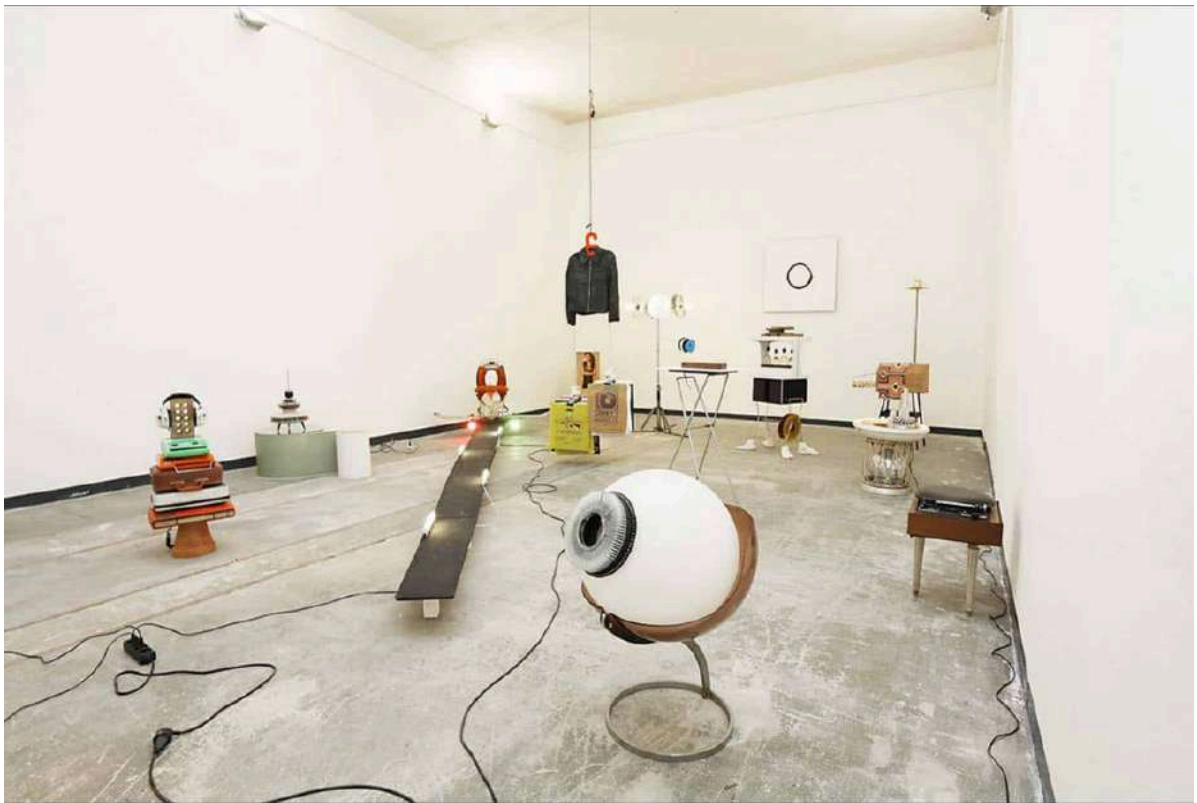
Arnaud Maguet - Vue de l'exposition Exposer ce qu'on ne veut plus voir, Espace à Vendre 2021