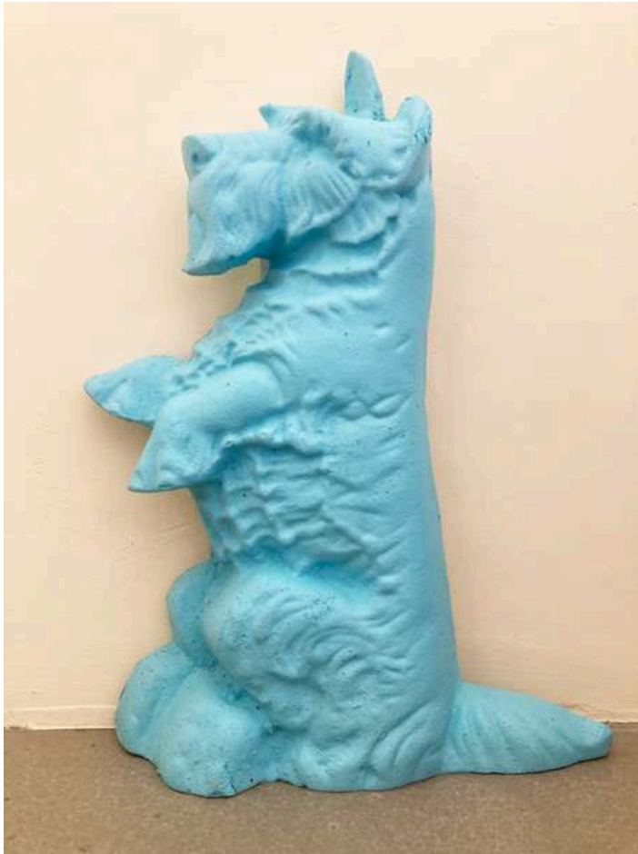
Olivier Millagou - Sculpture périmée (Scottish Terrier), 2024 Résine pour étanchéité périmée

A chaque instant de la production, le résultat est le fruit de l'aléa de la rencontre de la rencontre de matériaux délaissés et des propriétés de leur matière, dessinant une véritable sérendipité artistique. En parlant de "travail à deux mains avec la matière" (la sienne et celle de la matière), l'artiste introduit même l'idée d'un animisme matériel, d'une force active de la matière.