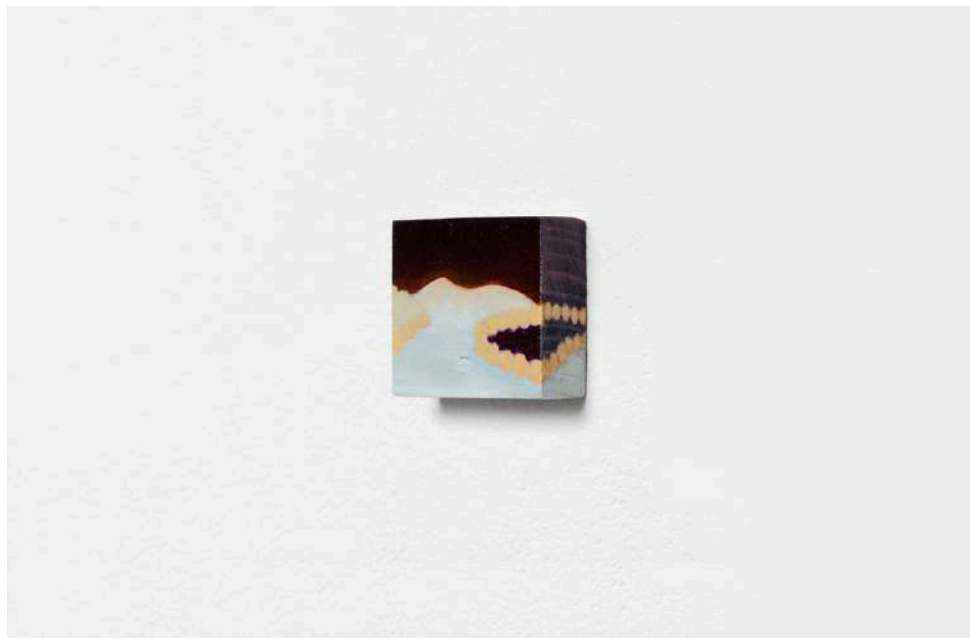
Sophie Varin - Truth Gap 1, 2021