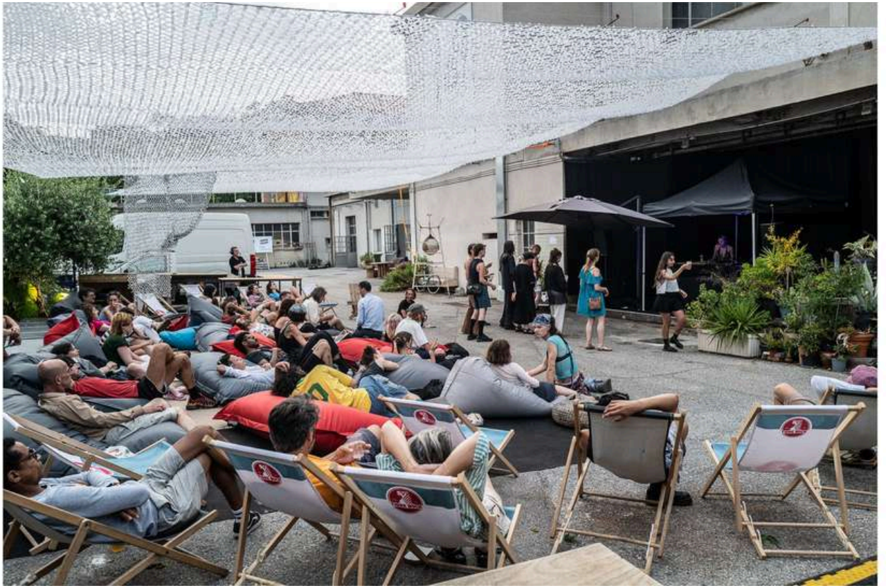
Photographie Witch You Were here 2023