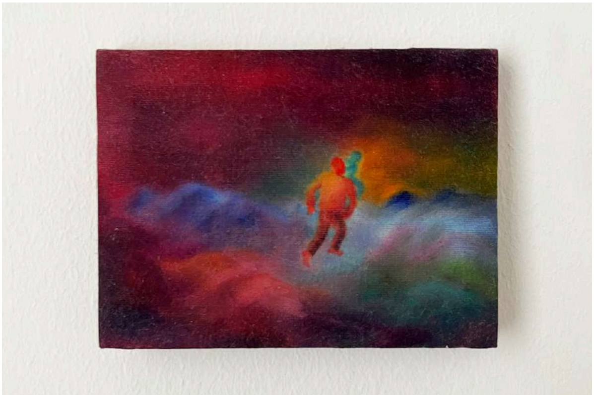
Sophie Varin, Sans titre, 2021